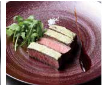
長野県産信州プレミアム和牛のワサビ焼き 燻製醤油の香り ¥4800

オードブル 1~2名様用 ¥2500 3~4名様用 ¥4500 DRAWINGの前菜をふんだんに盛り込んだご満足いただけるオードブルです。 (写真は4名様盛り)