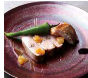
青森県産八甲田ポークの低温ロースト カカオビネガーと金柑 ¥2800