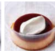
北海道産玉艶卵のこだわりプリン ¥600