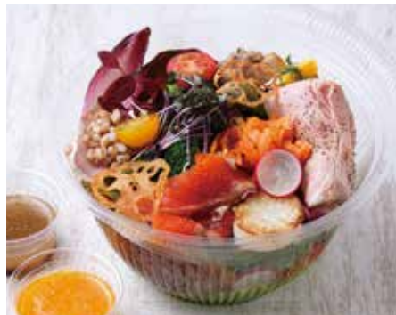
30品目のバレットサラダBOX ¥1600 (パン付)