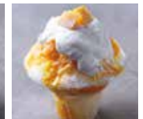
かき氷 宮崎産マンゴー ¥1500