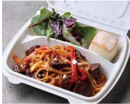
本日のシェフおすすめパスタBOX ¥1500 (サラダ、パン付)