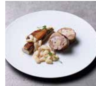
岩手県産ホロホロ鶏 2種の調理法 そのジュレで炊いた白いんげん豆 ¥3600