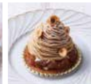
和栗クリームとマロングラッセのモンブラン ¥600