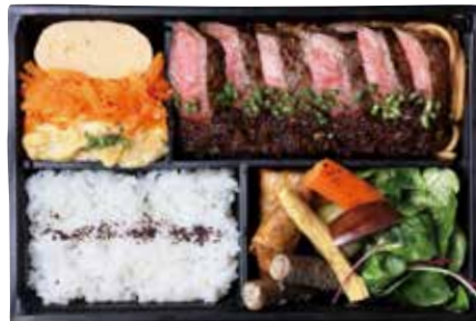
長野信濃牛のステーキBOX ¥3000