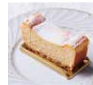
バイクドチーズケーキ ¥500