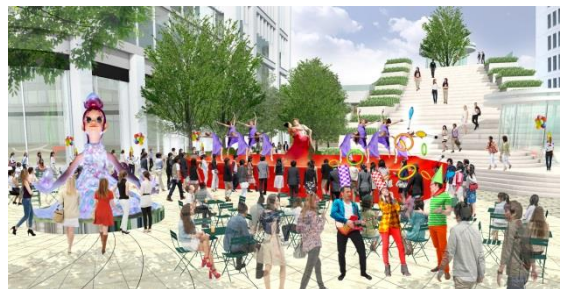
※記載のバースはイメージであり、今後変更になる場合があります。

地元企業、町会、商店会など地域の皆様と一体となり日比谷らしい街づくりを進めていきます。地域の皆様と組織したエリアマネジメント組織(一般社団法人日比谷エリアマネジメント)と連携し、2018年4月26日から開催する「Hibiya Festival」をはじめとした様々なイベントを開催するとともに、周辺施設とも連携して「芸術文化・エンターテインメントの街」日比谷の魅力を発信していきます。