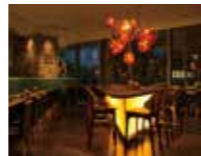
東京ミッドタウン日比谷 2F TEL:03-6550-8765