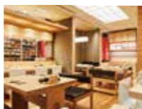
東京ミッドタウン日比谷 3F TEL:03-6811-2381