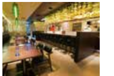
東京ミッドタウン日比谷 2F TEL:03-6812-7114