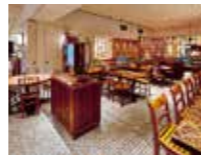
東京ミッドタウン日比谷 B1 TEL:03-5521-1025