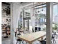
東京ミッドタウン日比谷 6F TEL:03-3519-3700