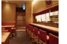
東京ミッドタウン日比谷 3F TEL:03-6812-7123