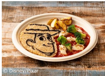
▲「トイ・ストーリー5」カフェスタンド メニュー画像 (中央上・中央下)