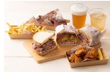
▲HIBIYA SUMMER DINER メニュー画像 (右上・右下)