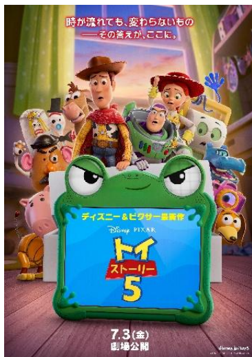
▲ディズニー&ピクサー映画最新作 『トイ・ストーリー5』

また、同じく日比谷ステップ広場では約100席の屋外ダイナー「HIBIYA SUMMER DINER」も開催。自家製コントロールティーヤを使った本格タコスと、スパイシーでスモーキーな自家製パストラミを主役に据えたサンドイッチのブースが出店。生ビールやハイボール、見た目も華やかなフローズンカクテルとともに、友人・家族と日比谷の夏夜をお楽しみください。