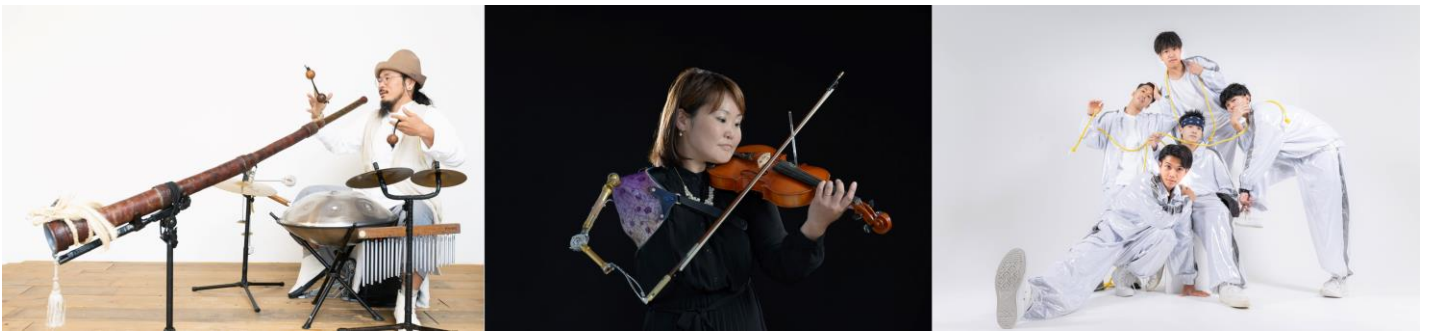
選出されたアーティスト（一部）

東京ミッドタウン日比谷（千代田区有楽町 事業者：三井不動産株式会社）を運営する東京ミッドタウンマネジメント株式会社が、芸術文化・伝統芸能の発信と若手のアーティスト活躍応援を目的として実施する「あなたが“NEXTアーティスト”～若手応援プロジェクト～2025」企画において、選考により13組の「NEXTアーティスト」が決定いたしました。選出された「NEXTアーティスト」は、2018年から開催しているエンターテインメントの祭典「Hibiya Festival 2025」への出演を確約。東京ミッドタウン日比谷をはじめとした商業施設やレストランなど、日比谷の街中でのパフォーマンスを予定 ※1 しています。