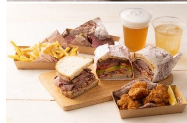
▲HIBIYA SUMMER DINER メニュー