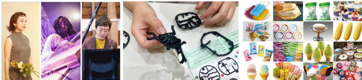
▲HIBIYA MUSIC LIVE 出演者

この度、「HIBIYA SUMMER DINER」にて、食事と一緒にジャズなどを生演奏で楽しめる「HIBIYA MUSIC LIVE」の開催が決定！また、体験を通してSDGsについて学べる「MOTTAINAI！アップサイクルワークショップ」をお盆期間に館内で実施します。そして、日本アイスマニア協会が全国47都道府県から厳選したご当地アイスが集結するクラフトソフトクリームとご当地アイスの専門店「あいぱく®TOKYO」が期間限定でオープンします。さらに、2011年に始まり、今年で14回目となる夏の恒例行事「エンタの街 日比谷 打ち水月間」も実施し、日比谷の街全体で夏のにぎわいを創出します。