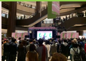
◆HIBIYA BLOSSOM ANNIVERSARY STAGE