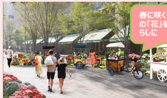
◆HIBIYA BLOSSOM MARCHE