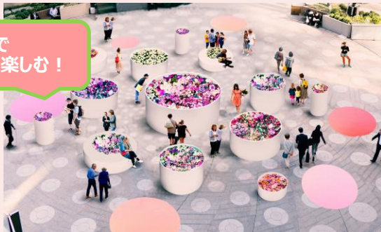
◆HIBIYA BLOSSOM GARDEN