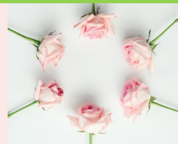
◆HIBIYA BLOSSOM FLORAL GIFT