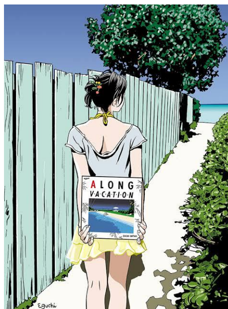
展示作品の一部(左：銀杏 BOYZ「君と僕の第三次世界大戦的恋愛革命」CDジャケット(2005)、 右：大滝 詠一「A LONG VACATION」40th トリビュートイラスト(2021)) ©2023 Eguchi Hisashi

漫画家・イラストレーターとして活躍する江口寿史氏は、東京という街と街の中で輝く人々の瞬間を克明に描き、街と人の魅力を伝え続けています。今回、東京ミッドタウン日比谷が5周年を迎え、日比谷エリアの様々な場所も周年を迎えることから、街とエンターテインメントをつなぐクリエイターとしてオファーし、日比谷ならではの特別展示として江口寿史イラストレーション展『東京彼女』が実現しました。