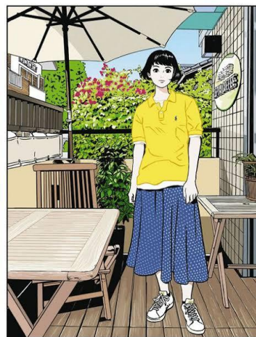
ラルフローレン公式 WEB インタビューのためのイラスト（2022） ©2023 Eguchi Hisashi