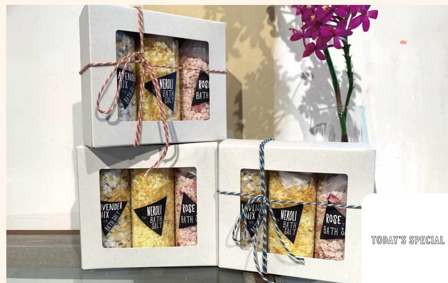
TODAY'S SPECIAL バスソルトセット 1,980円

ドイツ・シュニール織のブランド「フェイラー」から、#ゴルフ女子に向けてラウンド中も、タウンでも使えるアイテムが初登場! [フェイラー/2F/ライフスタイル雑貨/TEL.03-6257-1005]