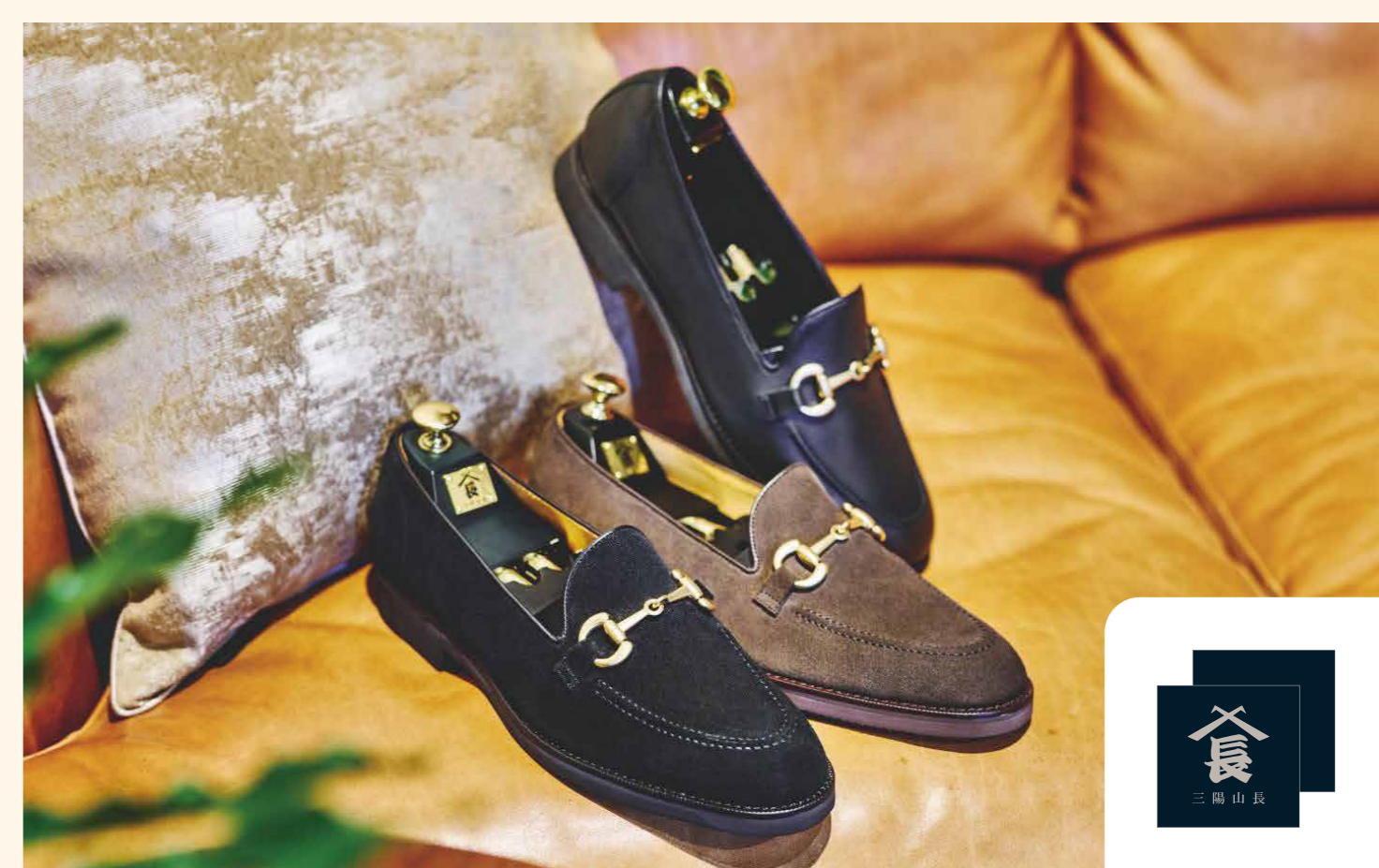
【悠二/YUJI】アンライニングビットローファー (サイズ:24.0cm~27.0cm) 59,400円

レトロなポップコーン柄が目を引くニットTシャツ。 柔らかくて立体感のあるテクスチャーが心地よい一着。 [well-made by MAIDENS SHOP/2F/ファッション/TEL.03-6812-7180]