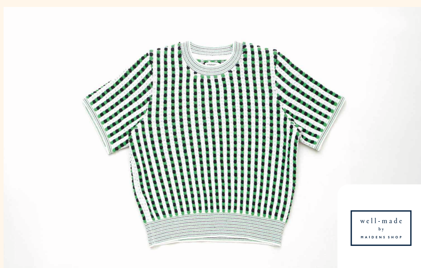
<COOHEM>RETRO WAVE KNIT P/O(カラー:WHITE) 27,500円

定番のカーネーションにバラや季節の小花を加えたカラフルなアレンジメント。器付きでそのまま飾って楽しむことができます。 ※画像はイメージです [BIANCA BARNET BY OASEEDS/B1/フラワーショップ/TEL.03-6550-8757]