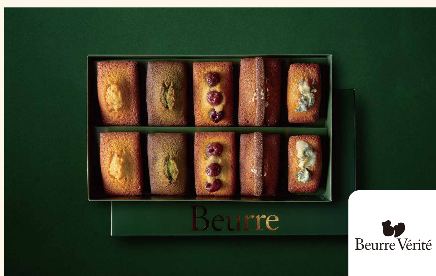
焼きたてフィナンシェ詰め合わせ 4,200円

フランス産発酵バターを使用した「焼きたてフィナンシェ」の詰め合わせ。期間限定の「チェリー」をはじめとする5種類をご用意。 ※店頭で焼き上げるため、当日分が無くなり次第終了となります [Beurre Vérité/B1/洋菓子・焼菓子/TEL.03-6205-7788]