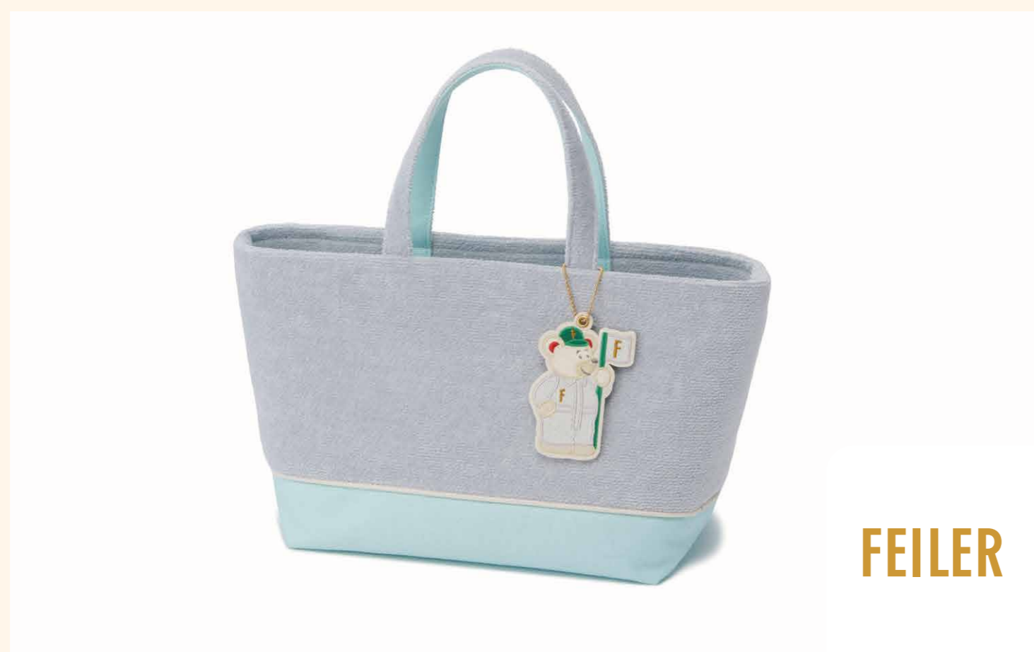
#ゴルフ女子 トートバッグ (シルバーグレー・約20x35x14cm) 22,000円

革の柔らかさを引き立て、足馴染みもいいセメント製法を採用。裏革を最小限にすることで、柔らかくノンストレスな履き心地です。 [三陽山長 /2F/靴・雑貨・メンズ・レディスファッション/TEL.03-6812-7130]