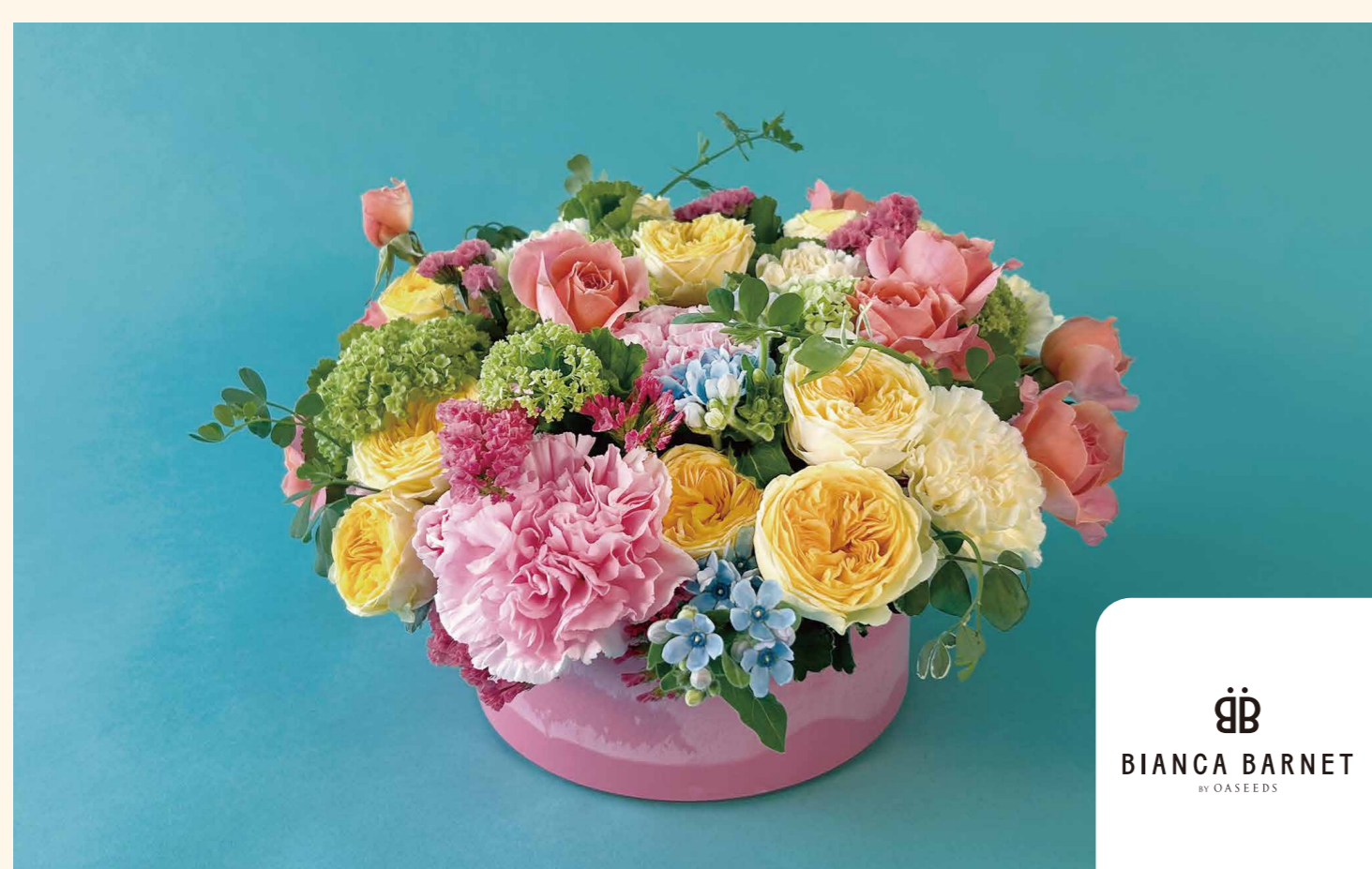
アレンジメント「カラフル」 22,000円

定番のカーネーションにバラや季節の小花を加えたカラフルなアレンジメント。器付きでそのまま飾って楽しむことができます。 ※画像はイメージです [BIANCA BARNET BY OASEEDS/B1/フラワーショップ/TEL.03-6550-8757]