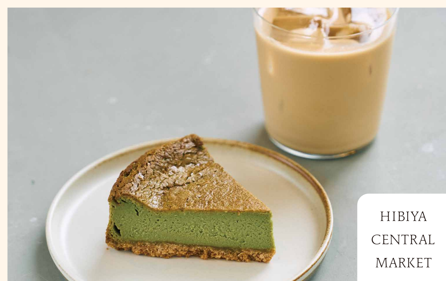
抹茶のチーズケーキ [単品]800円 [ドリンクセット]1,240円

米粉と水のみで練り上げたコシのある団子を、五街道で出会う土地をそれぞれの館で表現したLEXUS MEETS...のシグネチャーメニュー。 [LEXUS MEETS.../1F/カフェラウンジ/TEL.03-6273-3225]