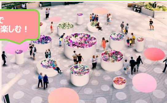
◆HIBIYA BLOSSOM GARDEN