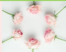
◆HIBIYA BLOSSOM FLORAL GIFT