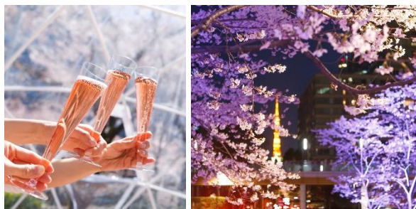
▲過去の開催の様子