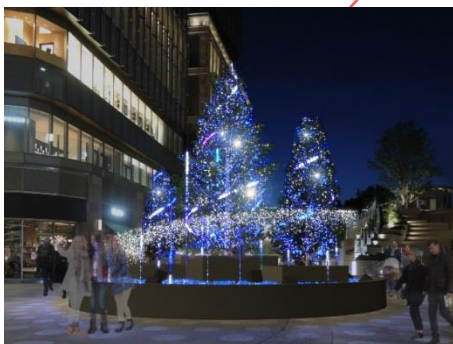
▲スターライトツリー イメージ