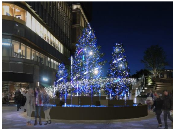
▲スターライトツリー イメージ