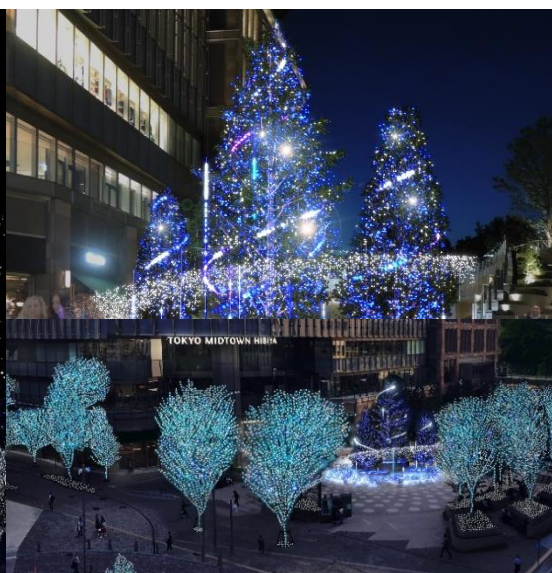
▲スターライトツリー イメージ (右上)