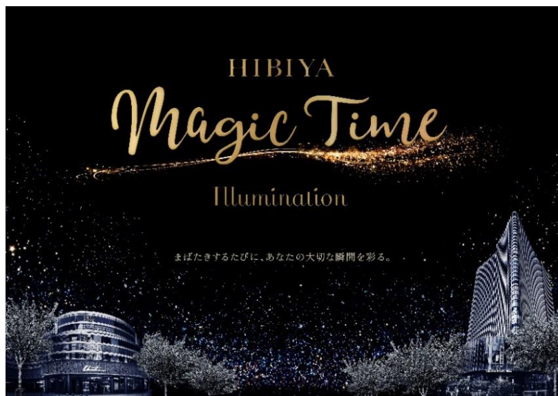
▲HIBIYA Magic Time Illumination キービジュアル

また、初日はスペシャルゲストを迎え、イルミネーションの点灯式を行う予定です。詳細は10月下旬頃にご案内いたします。