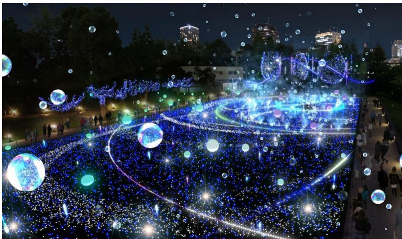
▲空間全体に広がるしゃぼん玉と光るバルーンの 期間限定特別演出「しゃぼん玉イルミネーション」（イメージ）

一般の方のお問い合わせ先：東京ミッドタウン・コールセンター 03-3475-3100（10：00～21：00）