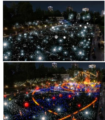
▲今年初登場の光るバルーンを約 100 個設置。 より華やかにスターライトガーデンを彩ります （イメージ）