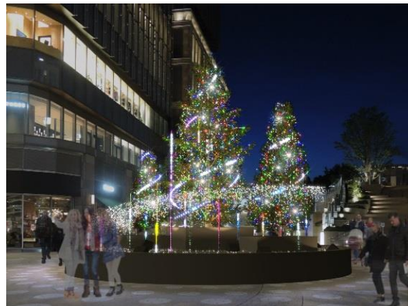
▲特別演出 イメージ