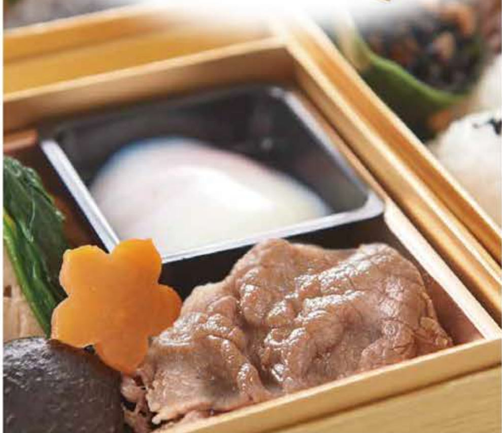
折詰かえで 黒毛和牛すき焼(モモ) 奥久慈卵温泉玉子 すき焼タレ 口取り 焼魚 天ぷら ローストビーフ輪切 香の物 天汁タレ