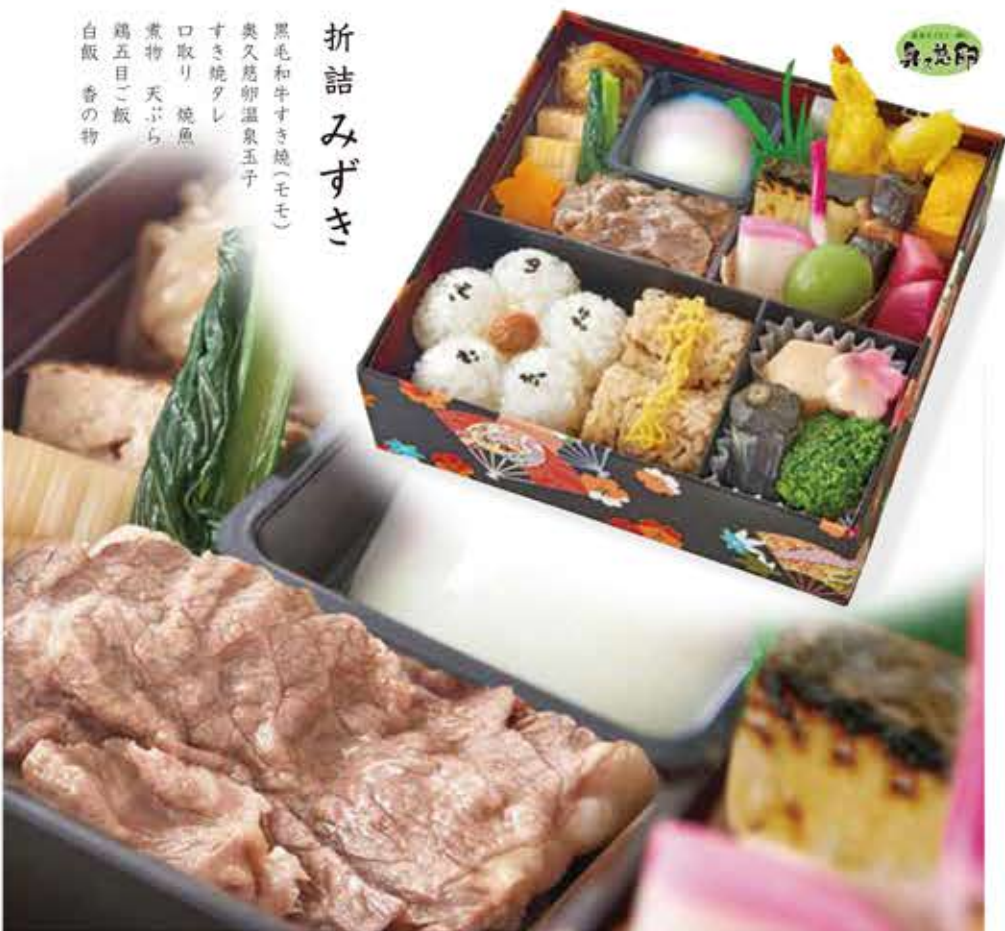
折詰みずき 黒毛和牛すき焼(モモ) 奥久慈卵温泉玉子 すき焼タレ 口取り 焼魚 煮物 天ぷら 鶏五目ご飯 白飯 香の物