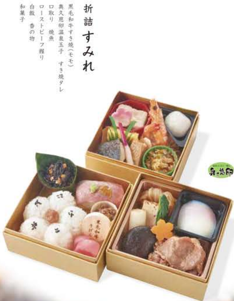
折詰すみれ 黒毛和牛すき焼(モモ) 奥久慈卵温泉玉子 すき焼タレ 口取り 焼魚 ローストビーフ握り 白飯 香の物 和菓子