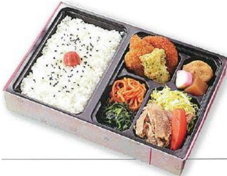
白身魚フライ/野菜コロッケ/竹輪磯辺天/煮物/豚肉ピリ辛炒め/コールスローほか