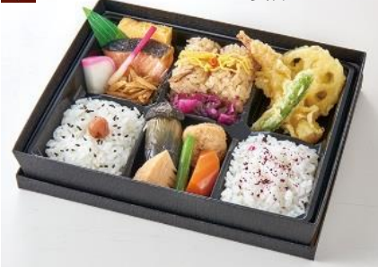
口取り/玉子焼き/焼魚/揚物/煮物/白飯/鶏五目ご飯/香の物