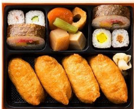
梅巻/かつぱ巻/太巻/干瓢巻/お新巻/いなり寿司/煮物