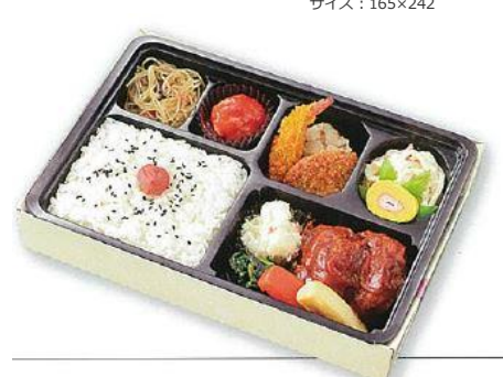
ハンバーグ/海老フライ/ポテトサラダ/かにかまロール/焼ビーフン/揚げ焼売ほか