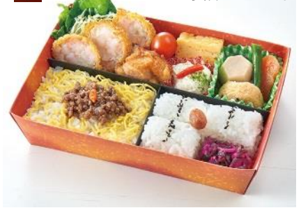
海老カツ/鶏から揚げ/玉子焼き/ポテトサラダ/煮物/牛もほろ/白飯/香の物