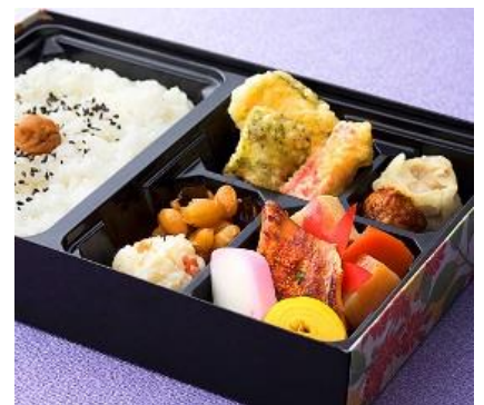
南瓜天/竹輪磯辺天/カニスティック天/昆布豆/ポテトサラダ/蒸し焼売/つくねボール/煮物/鯖七味焼/蒲鉾/玉子ロール/白飯