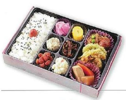
春雨挽肉痛め/ミートボール/煮物/天ぷら/玉子ロール/焼売/ポテトサラダほか