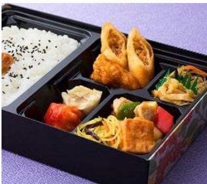
春巻/唐揚げ/イカフリッター/蒸し焼売/中華春雨サラダ/サーサイ/青椒鶏丁/焼ビーフン/家常豆腐/白飯