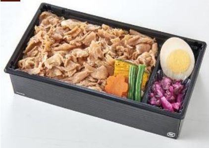
トウキョウX 豚肉/煮玉子/焼南京/隠元/人参/白飯/菜漬